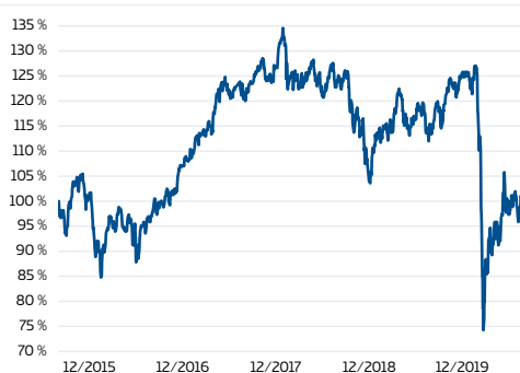
Wertentwicklung (inkl. Ausschüttung) zwischen 31.08.2015 und 31.08.2020