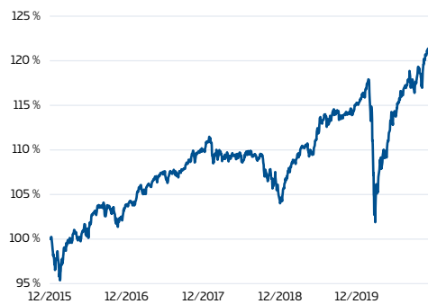
Wertentwicklung (inkl. Ausschüttung) zwischen 30.12.2015 und 30.12.2020