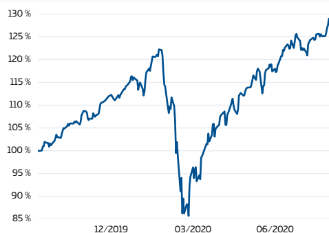
Wertentwicklung (inkl. Ausschüttung) zwischen 10.10.2019 und 31.08.2020