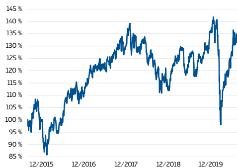
Wertentwicklung (inkl. Ausschüttung) zwischen 31.08.2015 und 31.08.2020