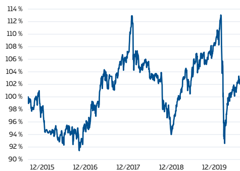
Wertentwicklung (inkl. Ausschüttung) zwischen 31.08.2015 und 31.08.2020