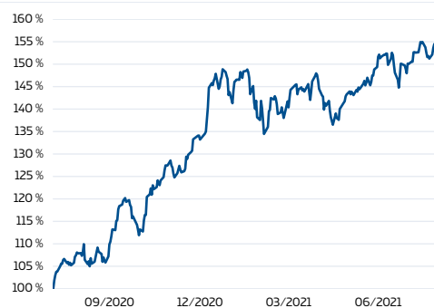
Wertentwicklung (inkl. Ausschüttung) zwischen 03.08.2020 und 31.08.2021