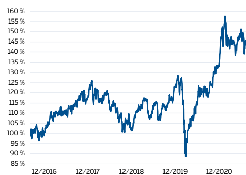
Wertentwicklung (inkl. Ausschüttung) zwischen 31.08.2016 und 31.08.2021