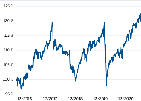
Wertentwicklung (inkl. Ausschüttung) zwischen 31.08.2016 und 31.08.2021